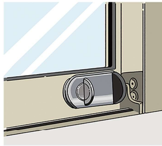
補助錠は、窓にも効果的。外から見えづらいモノも。ホームセンターなどでチェックしてみても？

●玄関ドアの防犯性を高める：ディンプルキー、ウェーブキーといった防犯性能の高い鍵に変えたり、防犯性能の高い鍵が付いた玄関ドアに変えるという手もあります。玄関ドア自体も一新できるのでおすすめです。