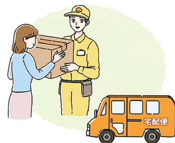
宅配便の配達員さんは決まった方が多いパターンなので、普段から覚えておいたり、部屋の窓から配達車両を確認するのも良いですね。

たり、「どこからですか？」など、荷物の詳細を確かめましょう。自分や家族が、宅配便で何をオーダーしたか共有しておく、より安心です。 ●置き配や宅配ボックスも有効：直接ドアを開けずに受け取ることができるので、リスクを減らせます。その際、カメラ付きインターホンや玄関まわりが見える窓から、周辺に不審者がいないか確認して、取りに行くのも良いですね。