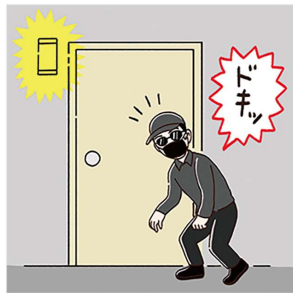
人感センサーライトや、カメラ付インターホンも、警戒心を高める心強いアイテムです。

●長時間いない場所の窓に気をつける：浴室やトイレの窓は、換気などでつい窓を開けっぱなしにすることも。部屋とは違い、人がいないことが多い場所は、長時間窓を開けておくとマクされることも。短時間の換気以外は施錠しましょう。