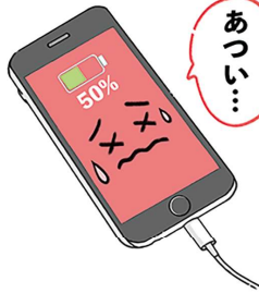
バッテリーのダメージに気を付けて、スマホを長持ちさせたいものですね。