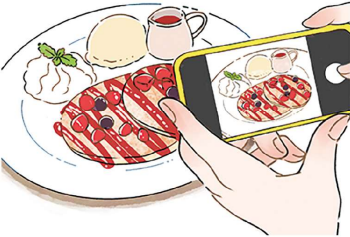
お皿を全部写さず、わざと切って撮るのもおしゃれですよ

テーブル上のモノを撮る際、被写体に照明の光や自分の影が映り込むときは、構えた位置からさらに上にスマホを移動し、いろんな角度で被写体をスマホの画面上で確認してみてください。照明の光も影も映らないポイントが見つかったら、そこから画面上