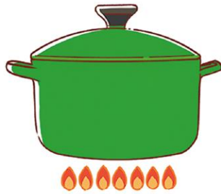
お湯を沸かすときはフタをすることで、熱が逃げるのを防ぎ、早く沸くので省エネにつながります。

料理のときに、煮込み料理は長時間火にかけなければいけません。短時間で仕上がる圧力鍋や、保温性が高い鍋を使うことも手です。保温性が