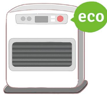
暖房器具は、暖めすぎを防ぐエコ運転などを利用するのも良いですね！

●お風呂を使うとき お湯の量を見直し、減らすことで、ガスの節約につながります。 お湯を沸かすときは、フタをすることで熱が逃げにくいので、早く沸き、保温にも役立ちます。